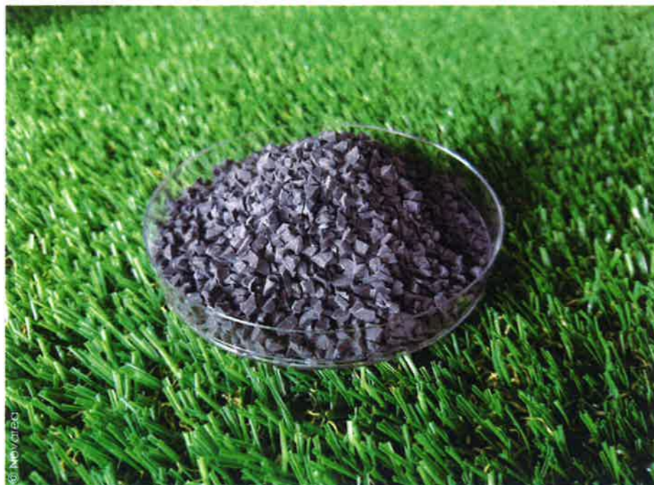
La production de ces granulats ne nécessite pas d'ajout de produit chimique : les pneus sont transformés en billes en extrayant le caoutchouc avec des outils industriels performants, il n'y a pas de transformation chimique de ce caoutchouc.

éventuel lien entre les terrains synthétiques et la survenue de cas de cancers auprès de joueurs de football. Il n'a pas observé de taux de cancers plus élevés chez les joueurs de football qu'au sein de la population totale.